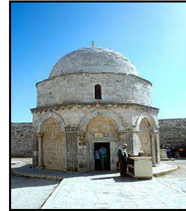
இங்கிருந்துதான் இயேசு கிறிஸ்து பரலோகத்திற்கு எடுத்து செல்லப்பட்டார்.